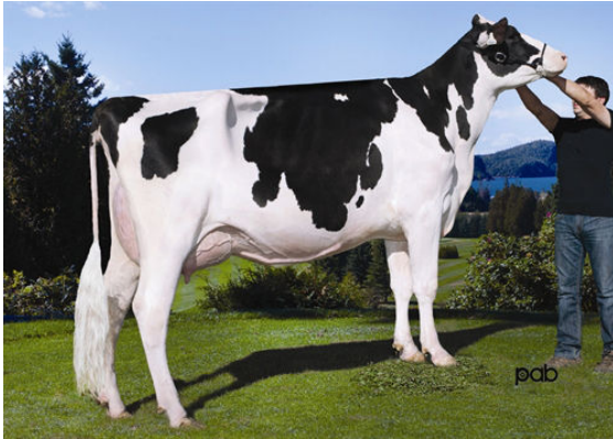
STE ODILE MANOMAN MOD PLATINE DAM